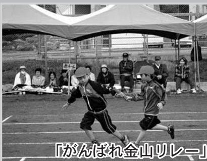
「がんばれ金山リレー」