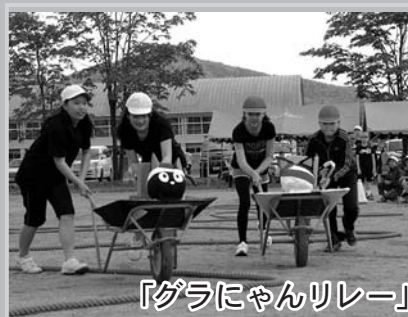
「グラにゃんリレー」