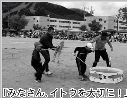
「みなさん、イトウを大切に!」