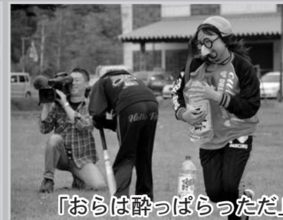
「おらは酔っぱらっただ」