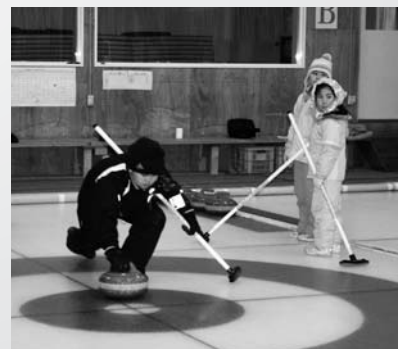
楽しいカーリングの学習

みんなに新年とどけます 今年も地域の皆様や、他の学校等でも楽しみに待っていてくれる、恒例の版画カレンダーを、完成させることができました。子どもたちは、今年度の活動を振り返って題材を選び、心を込めて版画の版を作り上げました。それを保護者との共同作業で印刷し、製本して出来上がりとなります。完成させたカレンダーは、2学期終業式の後、子どもたちと一緒に地域に配布しました。「待ってたよ」「上手だね」「学校の様子が良く伝わってくるね」とみなさんとても喜んで下さいました。