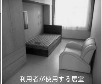
利用者が使用する居室