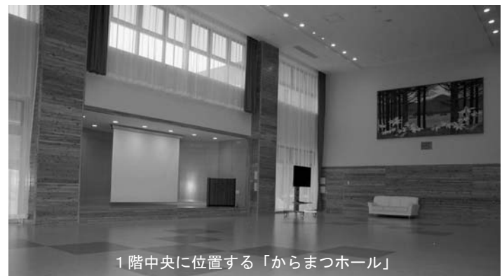
1階中央に位置する「からまつホール」

居室は個室が70室、二人部屋が5室で、1階は女性、2階を男性利用者が使用し、一室12.5㎡（約7.5畳）の個室にはクローゼット、ベッド、ソファアール、テレビ、収納棚などが配置され、少人数でのユニット化された施設内は家庭的雰囲気中で、潤いある生活空間となっています。東施設長は、「個室化することにより、利用者がプライベートな時間を持つことができ、これまでより落ち着いて生活されているようです」と利用者の様子を話されました。