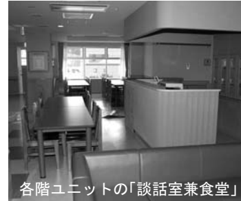
各階ユニットの「談話室兼食堂」