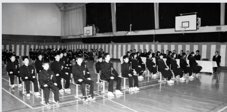
△南富良野中学校（24名入学）：在校生に迎えられた入学式