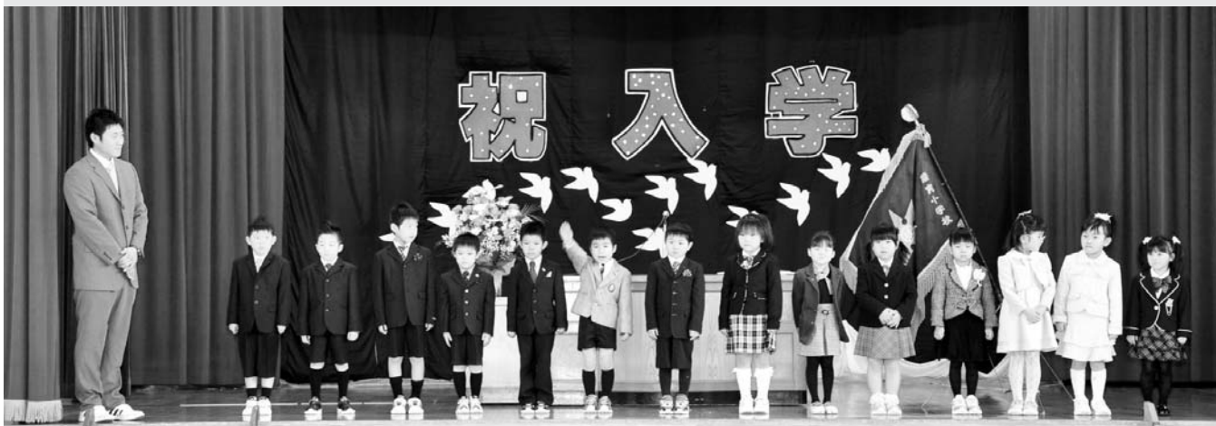
△幾寅小学校（14名入学）：舞台上で名前を呼ばれ、元気に返事をする1年生