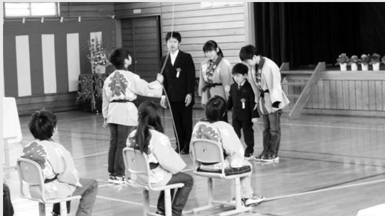
△金山小学校（1名入学）：在校生にやさしく迎えらる1年生