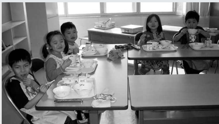
△落合小学校（5名入学）：笑顔がこぼれる初めての給食

また、4月8日には南富良野高校で入学式が行われ、11名の新入生が将来への夢と希望を胸に新たな学校生活が始まりました。