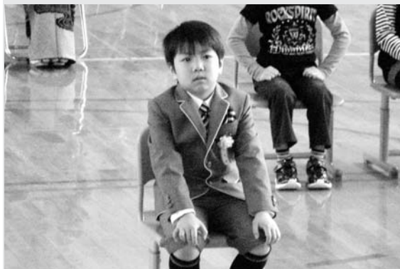
△下金山小学校（1名入学）：緊張した入学式