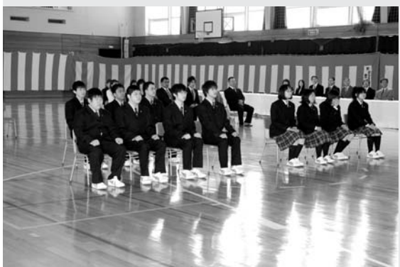
△南富良野高校（11名入学）：希望を胸に入学式