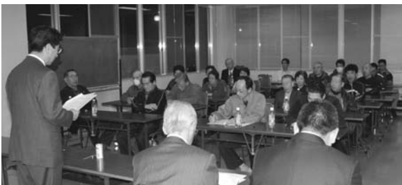
これらのご要望などについては、その緊急度や効果などを勘案し、財源の許す限り予算化に向けて努力してまいりますので、町民皆様のご理解とご協力をお願いいたします。 >12月3日 金山地区

やパークゴルフ場への草刈機設置、テレビの難視聴対策、フットパスの整備、スクールバスの運行経路および運行時刻の見直し、マイマイガ駆除対策、農業に対する支援策など、地域に密着した課題について要望がありました。また、公営住宅東団地跡地の活用計画や光ファイバーの整備計画、町立診療所の運営体制、学校施設の耐震調査、小学校の統廃合などに関する質問などがあり、町長および各担当課長から町の考え方や対応策などを説明しました。